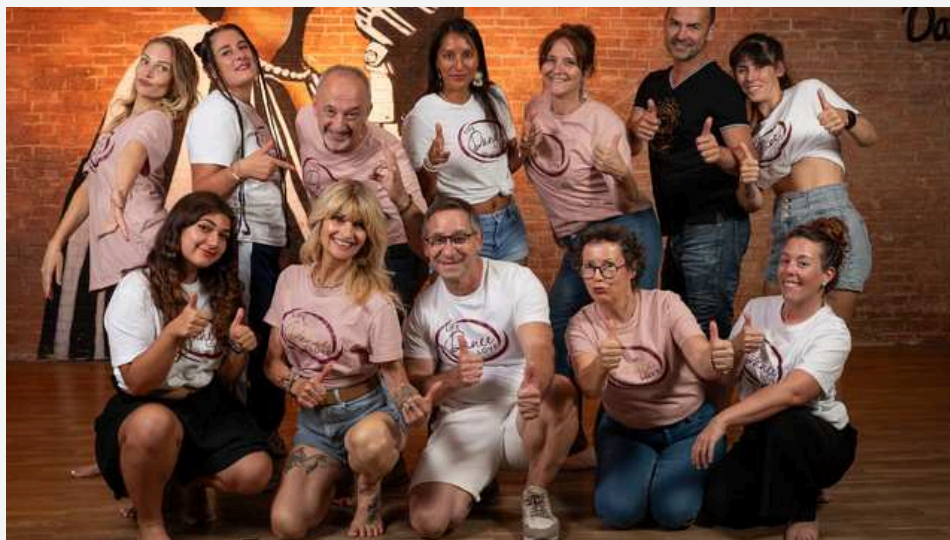
l'équipe Swing Cat 2024/2025